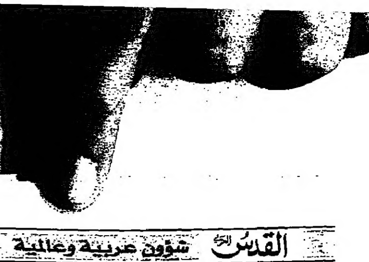
القديس... شؤون صربية وصانعية